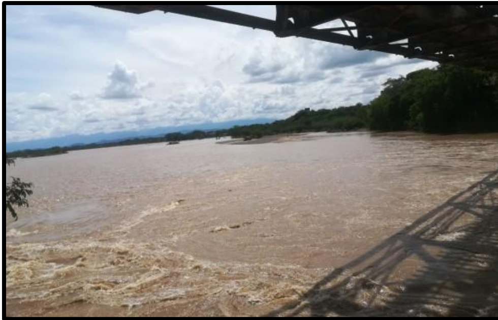
Imagen 2 Río Saldaña